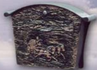
Postkasten 50 682