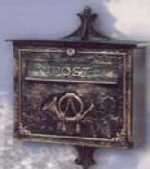
Postkasten 50 671