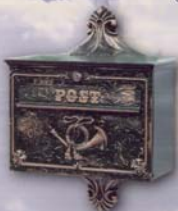
Postkasten 50 672