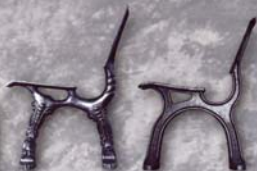
Gestell „Renaissance“ 50615